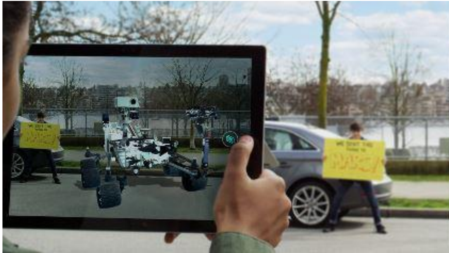
FOTO MAKEN OP JE PC

Bekijk 3D-objecten in jouw wereld en neem een foto van de omgeving met de camera op je pc.